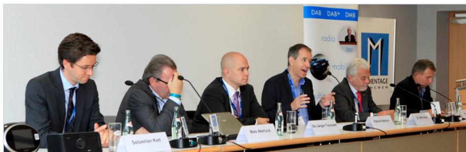
Diskussionsrunde auf den Medientagen München 2012

Wie Digitalradio und Internet eine neue Allianz eingehen können