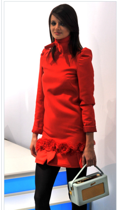
Rote Rosen Kleid und Radiogerät im Retro-Design