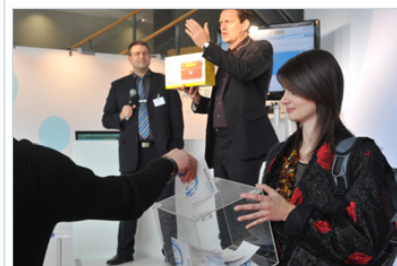
Show am BDR-Stand mit Gewinnspiel