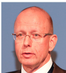
J. Metzger (Radio Bremen)