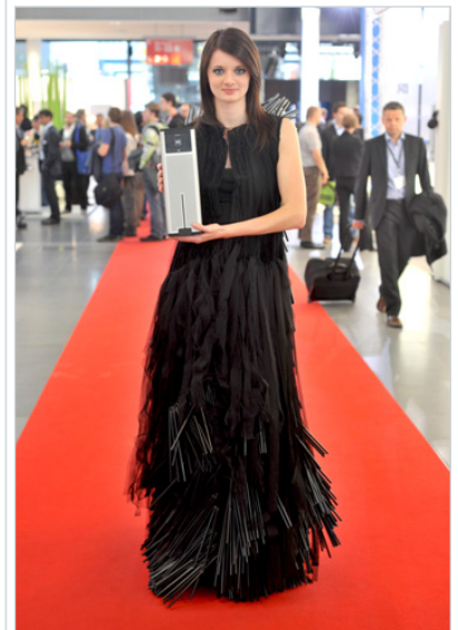
Abendgarderobe mit Strohhalmen und Radio von Revvo